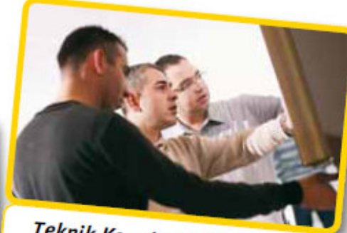
Teknik Konularda Uygulamalı Bilgilendirme