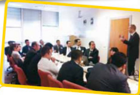
İlgili Departmanlarla Tanışma