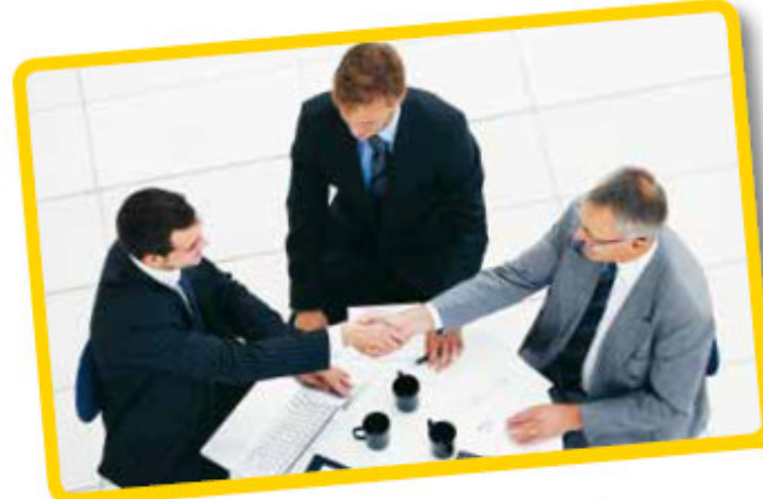
Satış Koçluğu Programı

“Satış müdürlerinin yıldızlara liderlik yaparken koçluk becerilerini artırmayı amaçlayan program”