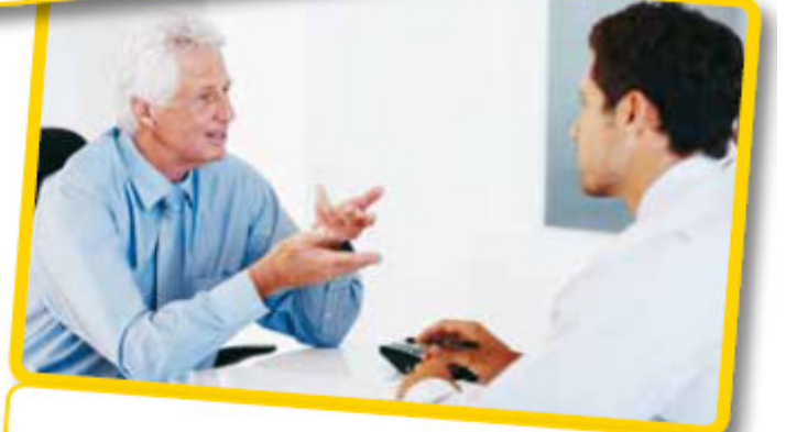
Bireysel Koçluk Görüşmeleri