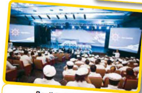
Bayii Zafere Götürme Simülasyonu