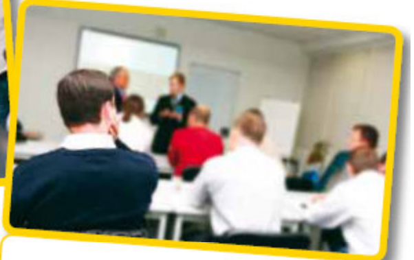
Saha Geliştirme Programı